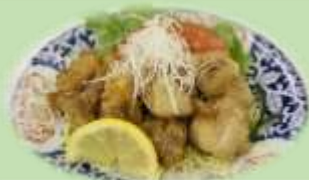
ユーリンチー定食